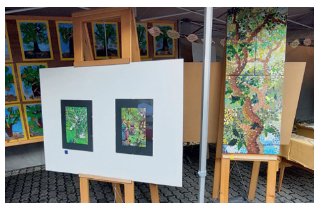
Commune de Montreux

Plus d'informations et galerie photo: www.montreux.ch/espaces-verts/histoires-darbres