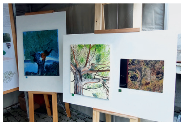
Commune de Montreux