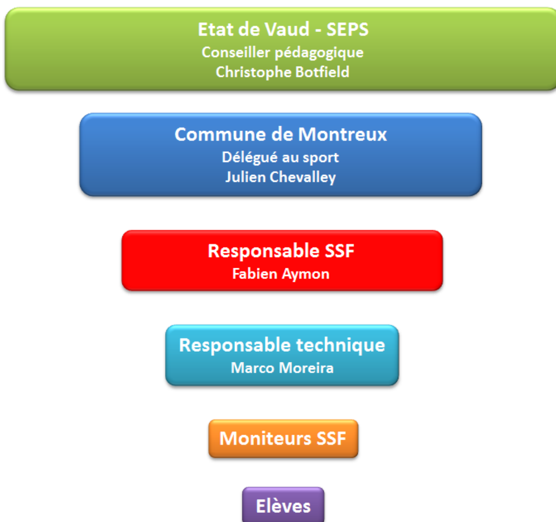
Tableau 1 : Organisation du SSF

Les moniteurs qui sont engagés par la Commune sont des MEP ou des entraîneurs des clubs et associations sportives de Montreux. Le fait qu'ils viennent directement de l'organisation permet une plus grande implication. Le but du SSF étant également de faire de la promotion des disciplines proposées sur le territoire de la Commune, le SSF est un excellent moyen d'attirer de nouveaux membres dans le club à la suite de l'initiation faite dans les cours SSF.