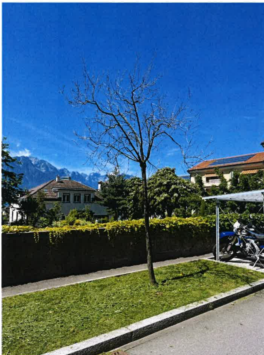
Parcelle DP 427, Av. des Amandiers, Prunus dulcis