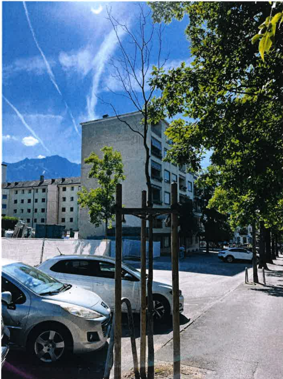
Parcelle DP 347, Rue William-Thomi, Liriodendron tulipifera