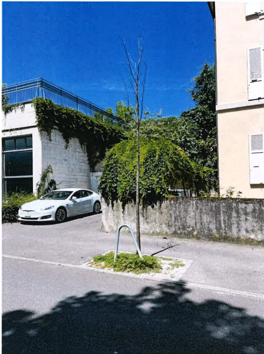
Parcelle DP 342, Av. Alexandre-Vinet, Liriodendron tulipifera