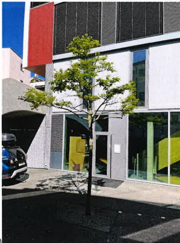
No 2 (973)