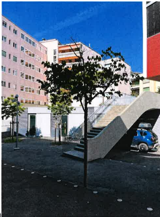
No 1 (972)