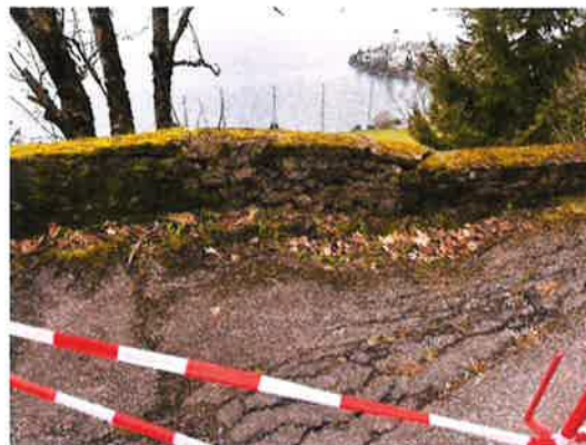
Situation au 30 janvier 2024 aval du mur