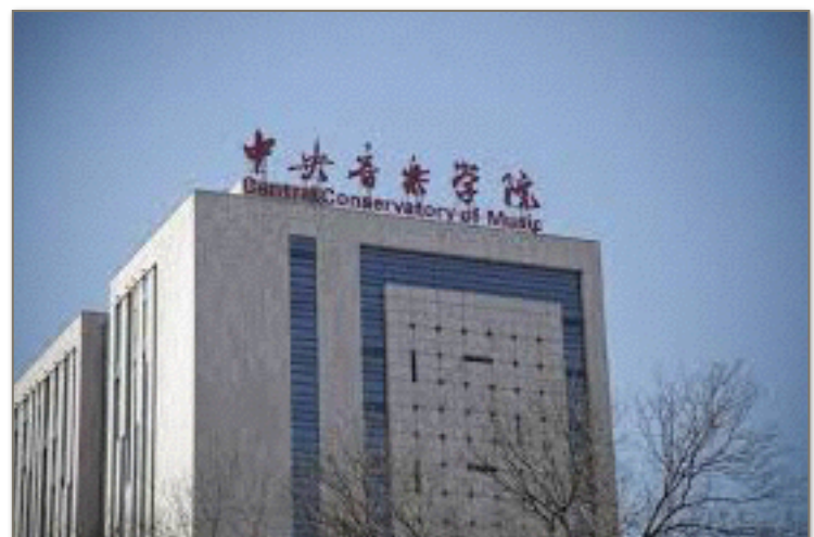
Conservatoire central de Pékin

Un des conservatoire les plus réputé est le conservatoire centrale de Pékin. Créé en 1950, on y apprend tout les domaines de la musique allant de l'apprentissage d'instruments, de la direction de chœur et d'orchestre à la musicologie. De nombreux artistes célèbres en sont sortis comme, par exemple, le plus célèbre: Lang Lang.