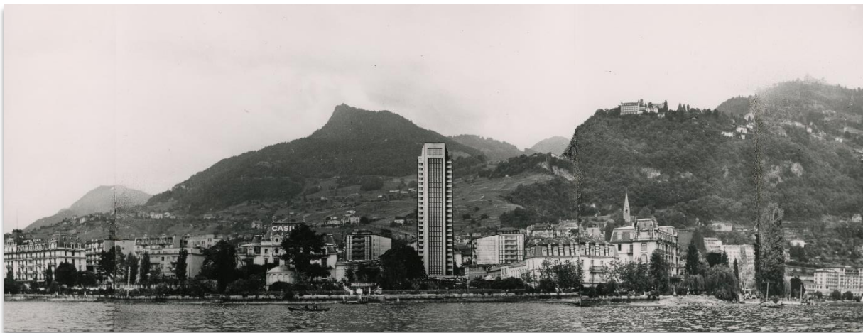
Fig. 1. Photomontage noir et blanc de la Tour d'Ivoire sur son futur emplacement, sans date [1959-1961].

Dès les prémices du projet un tea-room est envisagé au sommet de la Tour d'Ivoire 5 . L'un des vœux formulés par la Commune de Montreux pour sa construction consistait notamment à ce que le public et les touristes puissent accéder à son sommet et jouir de son belvédère 6 . L'Hôtel Richemont, démoli pour la construction de la tour n'est peut-être pas étranger à cette volonté 7 . « Le restaurant et son point de vue seront un élément d'attraction qui sera vite connu au loin et contribuera à soutenir le tourisme et l'économie de la localité ».