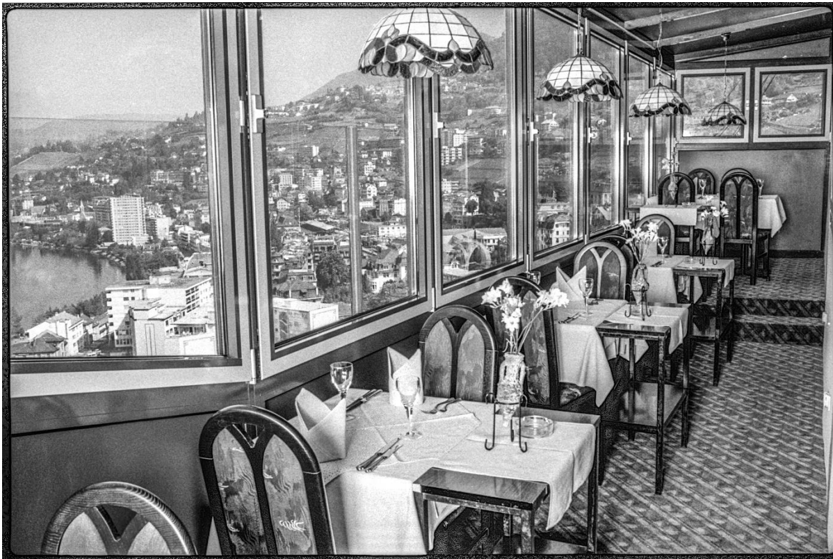
Le restaurant le Corsaire au sommet de la Tour d'Ivoire [1980]