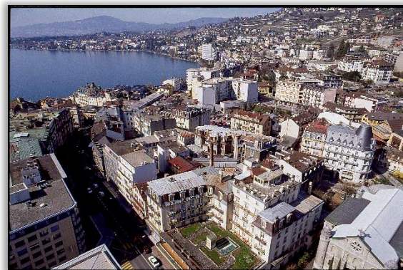
Fig. 3. Vue sur la Ville de Montreux depuis le restaurant de la Tour d'Ivoire.

bord du lac 9 . Une cinquantaine de places intérieures et vingt-deux sur la terrasse permettront au public de profiter d'une vue unique sur la région et d'y savourer des spécialités gastronomiques.