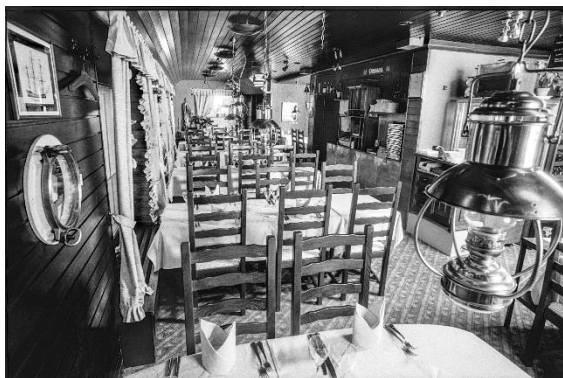
Fig. 4. Le restaurant le Corsaire et son décor de marine au moment de sa fermeture définitive.

Exposé aux vents et aux aléas météorologiques, les terrasses du « Corsaire » ne peuvent accueillir les clients par tous les temps. En février 1990, un projet de vérandas est mis à l'enquête publique 12 . Terminé en mai de la même année, cet agrandissement sera le dernier aménagement que connaîtra le restaurant. En décembre 1996, « Le Corsaire » ferme définitivement ses portes 13 . Le restaurant panoramique était-il passé de mode ? Selon le directeur de l'Office du tourisme de l'époque, la tendance du moment serait plutôt de « manger les pieds dans l'eau que la tête dans les nuages » 14 .