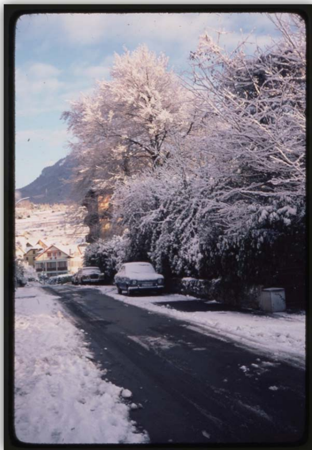
WILDI, Jacques : Chailly : Chemin des Écoliers enneigé, décembre 1980.

Diapositive couleur, Archives de Montreux, Fonds Jacques Wildi PP254 – B-1-05 i