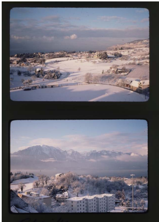
Figures 3 et 4 : WILDI Jacques, Panoramas enneigés depuis Chailly, 19 décembre 1980 (PP254-B-1-01 et PP254-B-3-01) 6