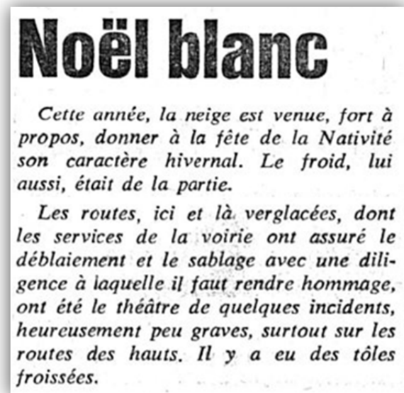
Figure 2 : Journal de Montreux, 28 décembre 1964 5

Peut-être certains d'entre nous se souviennent de l'année 1937 quand de très nombreuses personnes se sont amusées sur l'excellente neige des Rochers-de-Naye pour Noël 4 , ou encore de 1964 :