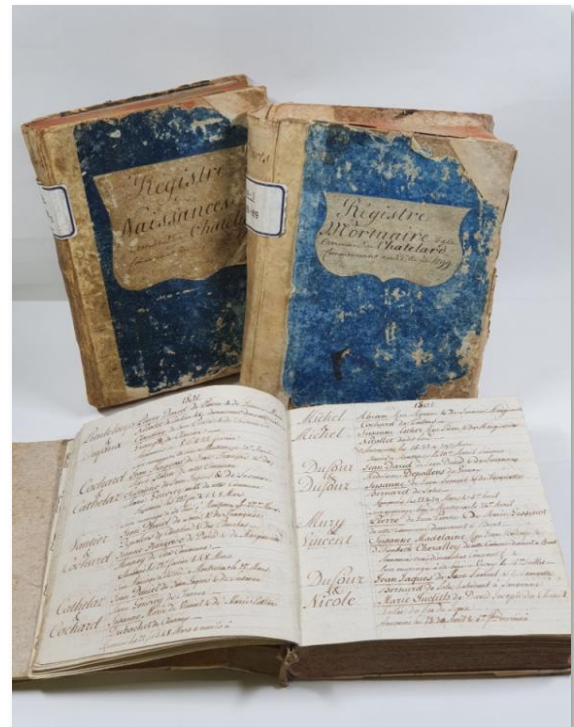
Fig. 1 : Registre des naissances, registre des mariages, registre des décès, 1799-1820. Archives de Montreux, Fonds de la Commune du Châtelard, CHD-R-A-001/002/003

De manière très résumée, nous considérons qu'il y a trois types de recherches généalogiques. Le premier englobe les professionnels de la généalogie qui exercent un véritable métier. Ceux-ci travaillent souvent pour des études notariales afin de retrouver des descendants en cas d'héritage. Ensuite, nous observons qu'il y a dans certaines familles des gardiens de la mémoire familiale. Ces généalogistes-amateurs éclairés consacrent souvent de longues années à la recherche d'informations minutieuses afin de construire leur arbre généalogique. Enfin, mais non des moindres, il y a toutes les personnes curieuses de mieux connaître leur origine, leur histoire. Ces personnes-là cherchent à comprendre le vécu de leurs ancêtres, au-delà des dates de naissance, mariage et décès.