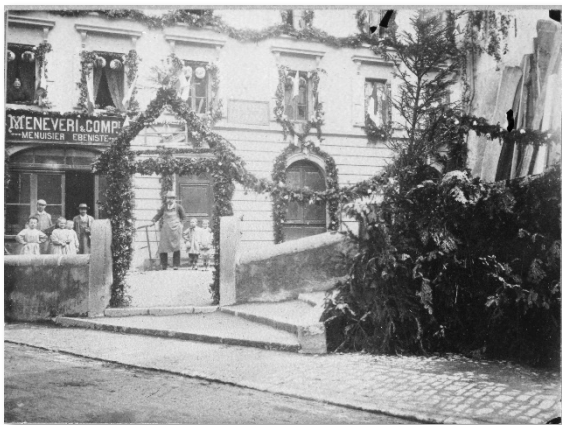
Fig. 5 : Fête du Centenaire aux Planches, 1903. Archives de Montreux, Fonds René Koenig, PP243-B-01-fk1987

Mais cette recherche a pris une nouvelle tournure quand, en recoupant les différents inventaires disponibles, nous avons pu mettre la main sur une photographie de la famille !