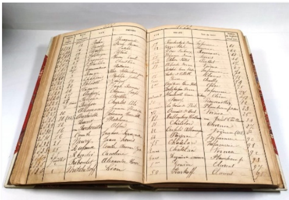
Fig. 2 : Registre des inhumations, 1871-1919.

comprendre que chaque demande est unique et soulève des questions familiales qui peuvent s'avérer très sentimentales.